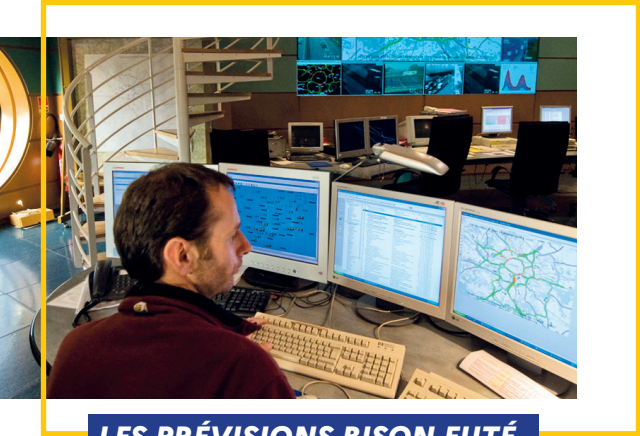
LES PRÉVISIONS BISON FUTÉ

Le cœur de métier de Bison futé est la prévision de trafic sur le réseau routier national en vue des déplacements de longue ou moyenne distance, notamment pendant les congés scolaires et autour des jours fériés. Le calendrier, qui donne les prévisions pour l'ensemble de l'année à venir, est complété par une trentaine de prévisions détaillées par an, disponibles quelques jours avant la période concernée. Elles précisent notamment les axes qui seront sous tension, les horaires à éviter, les chantiers éventuellement prévus sur ces axes et pouvant générer des ralentissements.